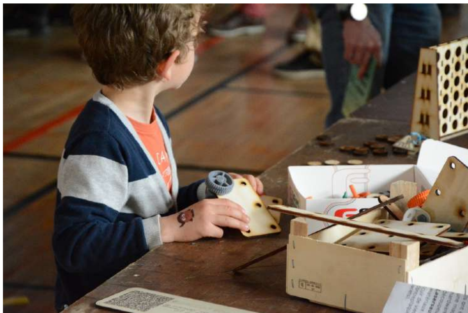
Atelier de fabrication de robots avec les enfants

Dès 10 ans et pendant tout le week-end, des ateliers créatifs, des jeux vidéo amusants et éducatifs sont à l'honneur pour les gônes ! Parce qu'aux Journées du Logiciel Libre, il n'y a pas d'âge pour s'initier, créer, s'amuser et découvrir.